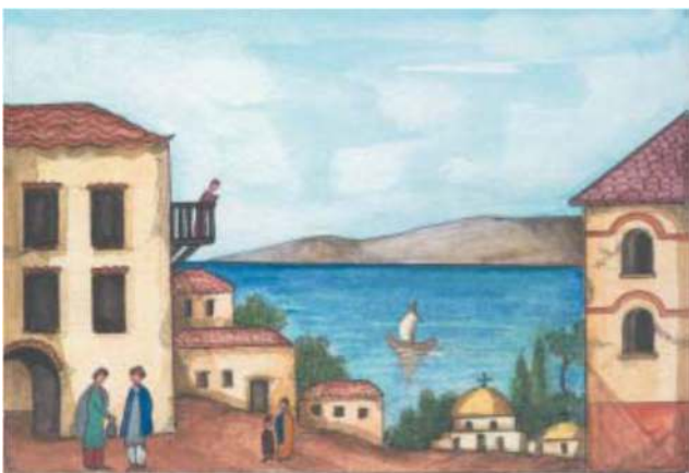
Γειτονιά της Πόλης

Την επίβλεψη της αγοράς είχε ο Έπαρχος της Πόλης , ο οποίος ενημερωνόταν τακτικά για την επάρκεια των αγαθών και τις τιμές τους, δίνοντας ιδιαίτερη προσοχή για τα είδη πρώτης ανάγκης.